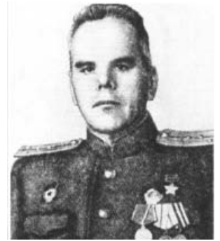
Пётр Трофимович Сокур

Пётр Трофимович Сокур (25.09.1911, с. Демковка, Подольская губерния - 11.10.1987, с. Брынь, Калужская область) - советский офицер, один из первых Героев Советского Союза